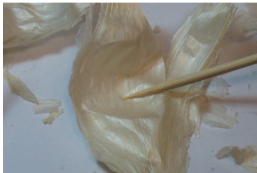
Mite on skin of elephant garlic