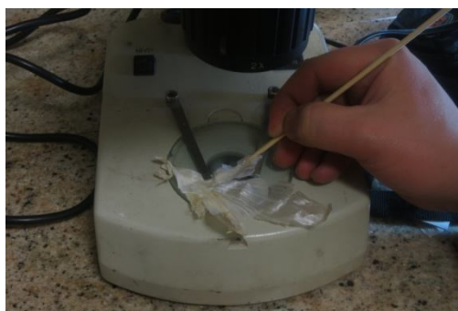
Peel under Microscope