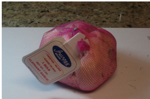
Elephant Garlic Product of Chile