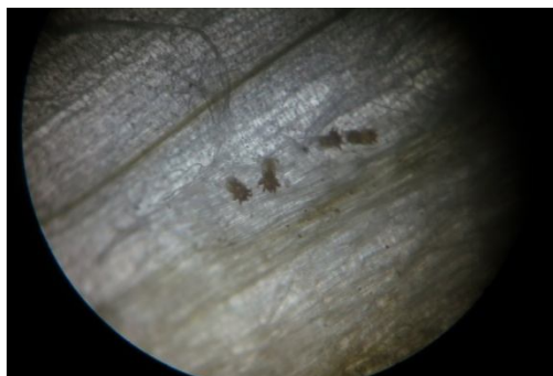
Several mites on one peel under microscope

לזכות רפואת רבנו חיים יהודה בן תנח ש"ט"א