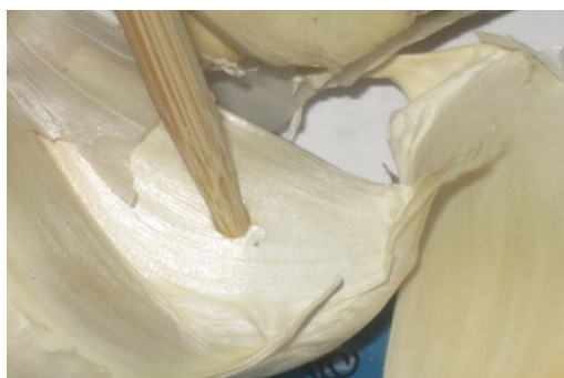
Mite on garlic - product of China