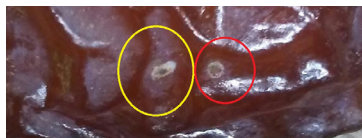
סקעילס אויף טייטלען

טייטלן פון אנדערע לענדער ווי פאקיסטאן, טוניזיע זענען היבש ווערימדיג. (פון טוניזיע זענען אויך פוהל מיט "סקעילס"), און עס איז נישט כדאי דאס צו נוצן.